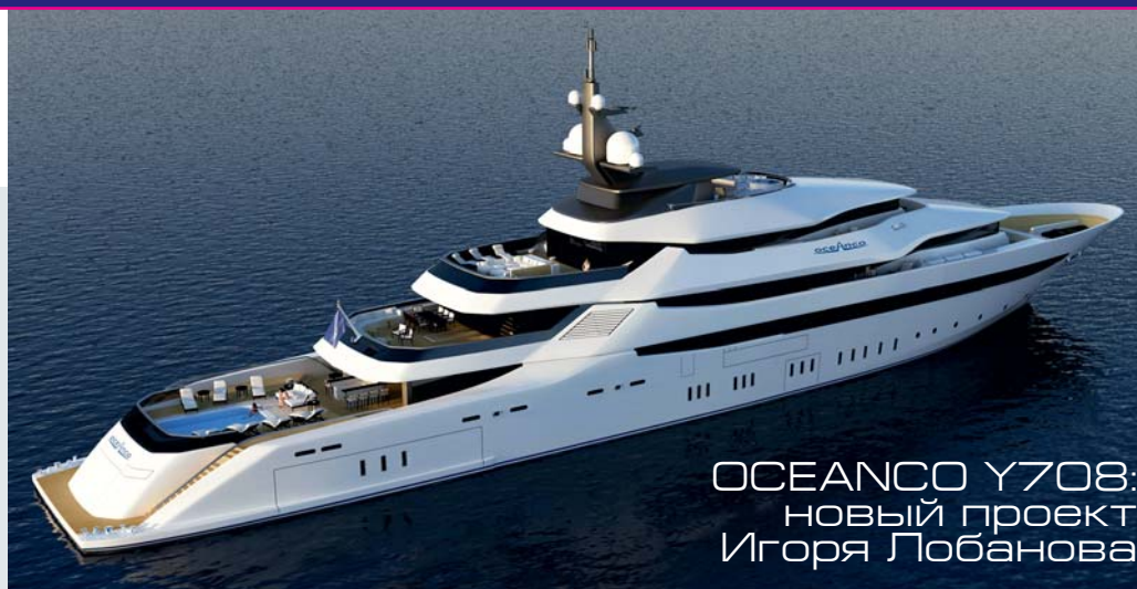
OCEANCO Y708: новый проект Игоря Лобанова