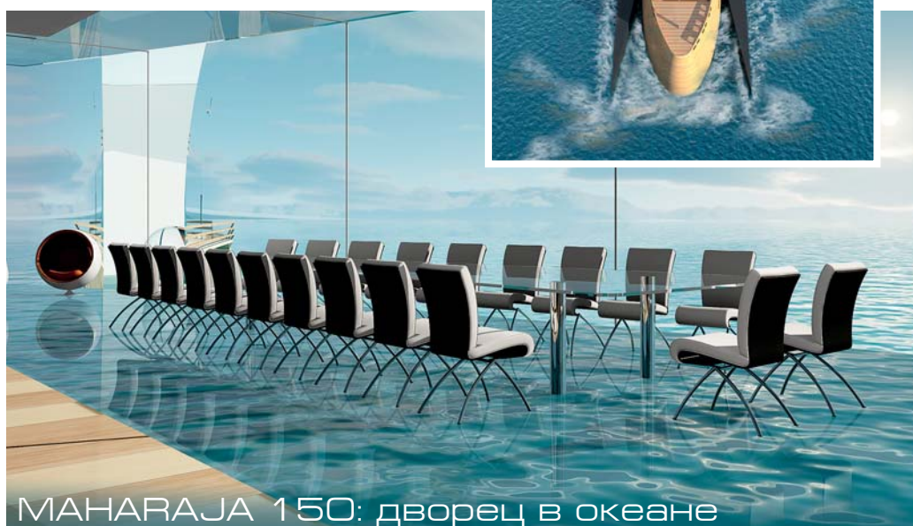
MAHARAJA 150: дворец в океане

Голландская верфь oceAnco обнародовала детали очередного крупного проекта — суперяхты Y708. 85-метровая яхта со стальным корпусом и алюминиевой надстройкой рассчитана на 14 гостей. Дизайн яхты создан россиянином Игорем Лобановым. Все палубы яхты спроектированы так, чтобы обеспечить потенциальным гостям полную приватность. В распоряжении владельца — отдельная палуба с выходом на личную солнечную палубу с джакузи и зоной для загорания. На верхней палубе расположены две VIP-каюты с балконами и салон, который может быть переоборудован под библиотеку или кинозал. На главной палубе находятся бассейн, способный превращаться в вертолетную площадку, бар и обширная зона для отдыха и развлечения гостей, а также четыре гостевые каюты. Индивидуальные балконы гостевых кают позволяют пассажирам наслаждаться морскими видами и свежим бризом независимо друг от друга. На нижней палубе к услугам гостей — спа, включающее в себя массажный кабинет, тренажерный зал, сауну и хаммам. Из спа открывается вид на море. Ориентировочная крейсерская скорость яхты с двигателями MTU мощностью по 4828 л. с. составит 14 узлов, дальность хода — 4750 морских миль. Судно может быть передано заказчику в 2012 году.